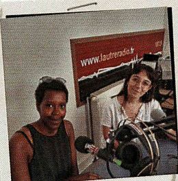
Émissions de radio