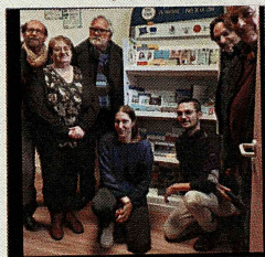
Inauguration de Points Europe