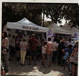
Fête de l'Europe