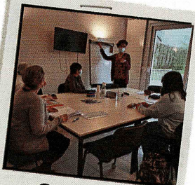
Cours de langues