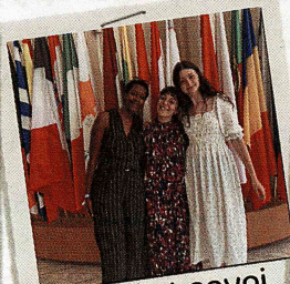
Accueil et envoi de volontaires européens