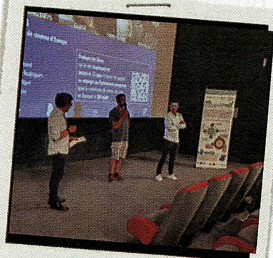
Organisation de conférences