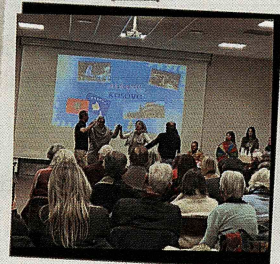
Noël en Europe